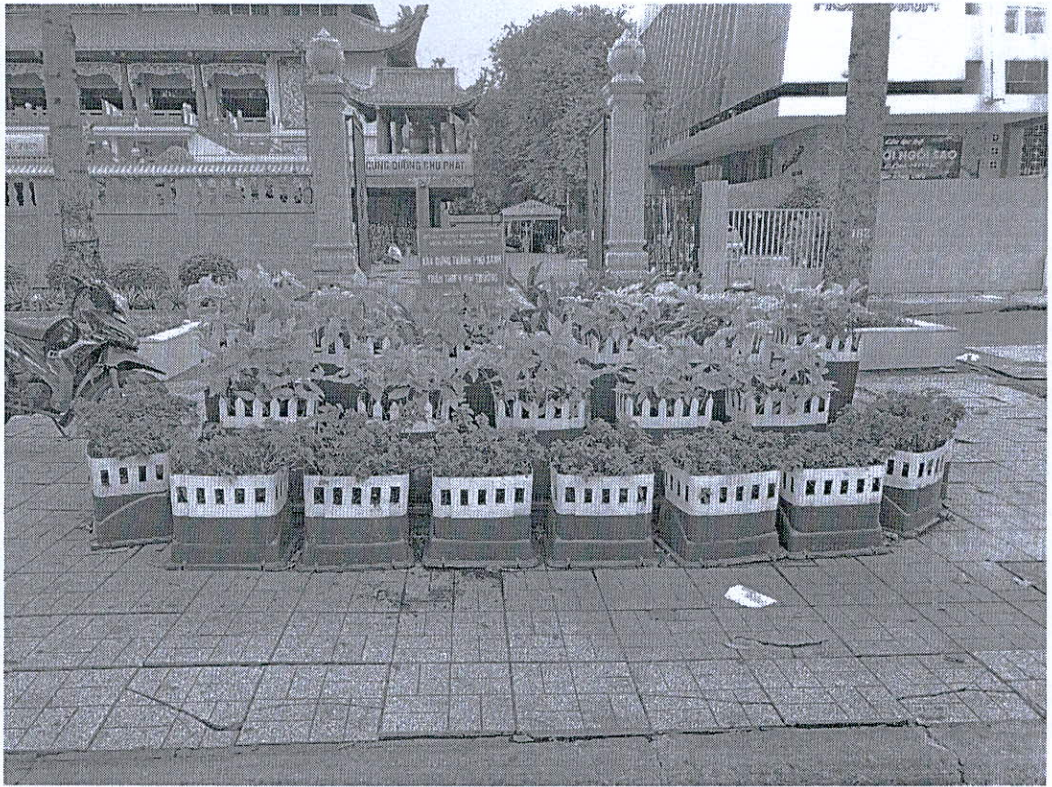
Hình ảnh: Trước chùa Việt Nam Quốc Tự Phường 12